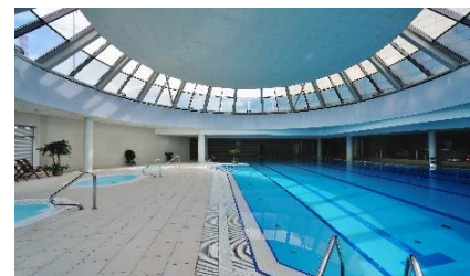
Exemplo de aplicação do KLORKLEEN PLUS