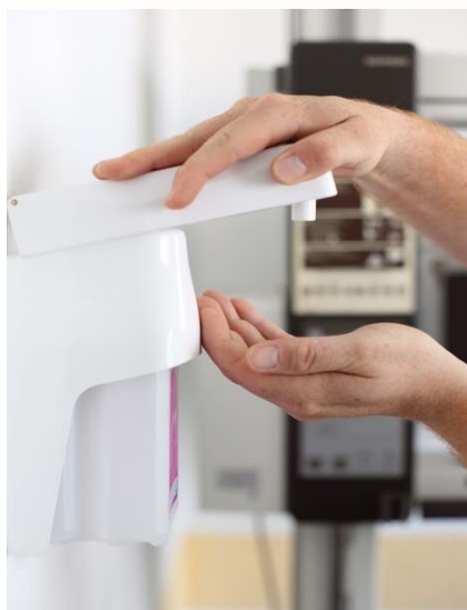
Exemplo de aplicação do BAKGEL

Bakgel pode ser aplicado com o doseador DOSIBAK.