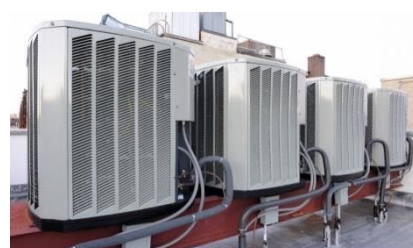
Exemplo de aplicação do SANITAB